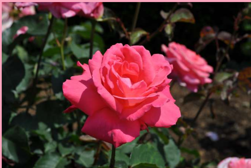
📍 西 2 1 ホウジュン Hohjun

This rose has a classic rose fragrance which is commonly used for various purposes. It is a luxurious scent and includes Ingredients of fragrances of Tea.