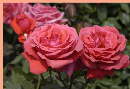
西26 フラグラント・クラウド