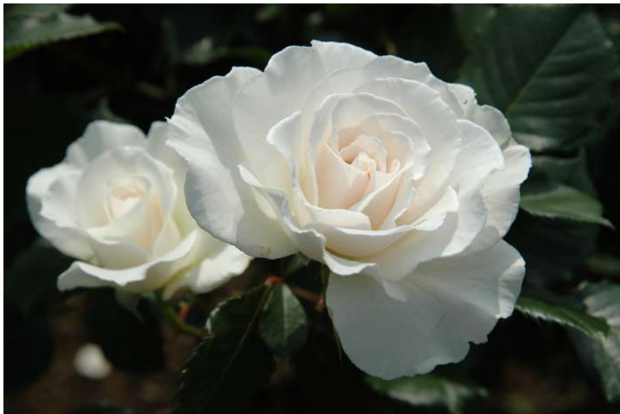
📍 西47 マーガレット・メリル Margaret Merrill

It transcends the fragrance of Damask Classic but due to its ingredient balance differing from the classic, it holds a more passionate, refined fragrance.