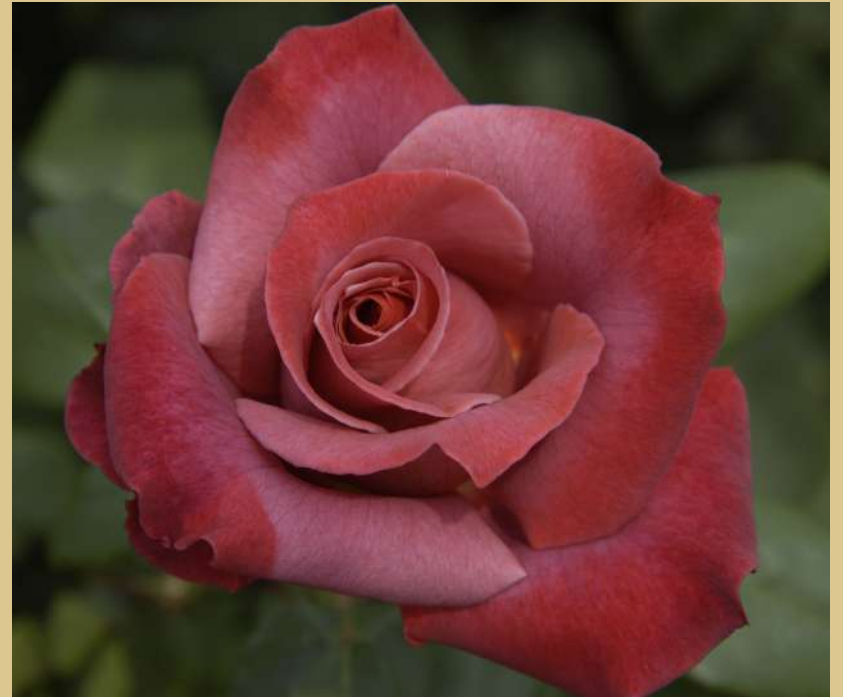
📍 西18 ブラック・ティー Black Tea