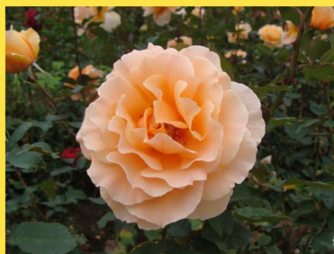
西23 ジャスト・ジョーイ