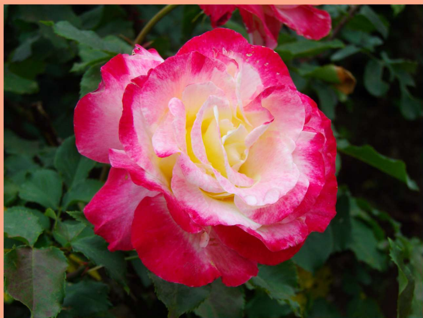
西25 ダブルデライト Double Delight

Damask modern scent and unique ingredients of tea are mixed in an exquisite balance.