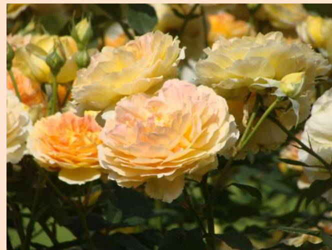
東38 モリニュー Molineux

The fragrance is similar to that of the herb Anise, but holding down on the sweet scent and bringing out the green, grassy scent more. It has been identified as one of the English Roses, and is commonly combined with scents like Damask or Tea.