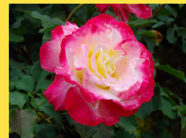
西25 ダブルデライト