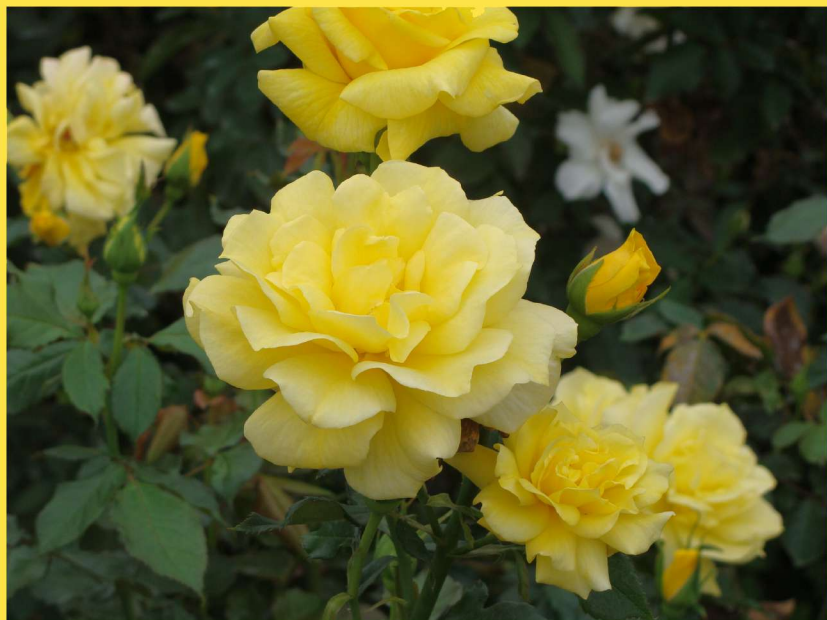
西4 フリージア Freesia

Damask modern scent and unique ingredients of tea are mixed in an exquisite balance.