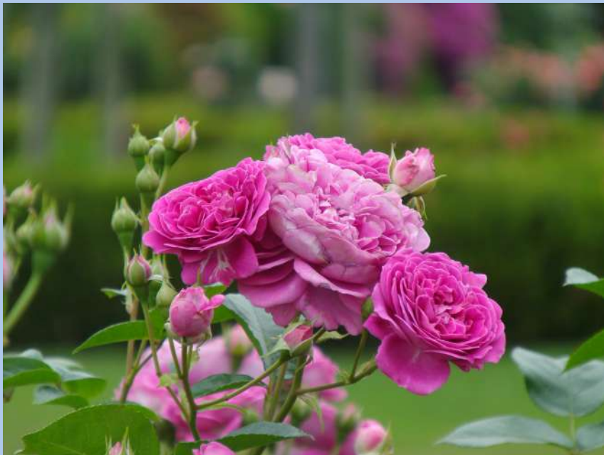
📍 東8 ブルーボーイ Blue Boy

A scent that is a mixture of damask classic and tea scents, which is unique to "blue rose" varieties with a blue flower color.