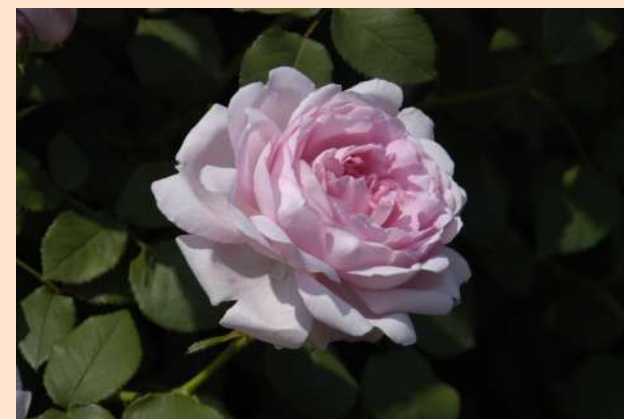
東42 ワイフ・オブ・バス Wife of Bath