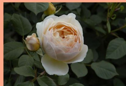
東46 ジュード・ジ・オブスキュア