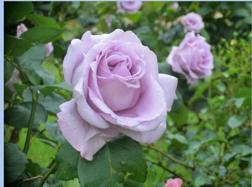
📍 東9 ブルームーン Blue Moon