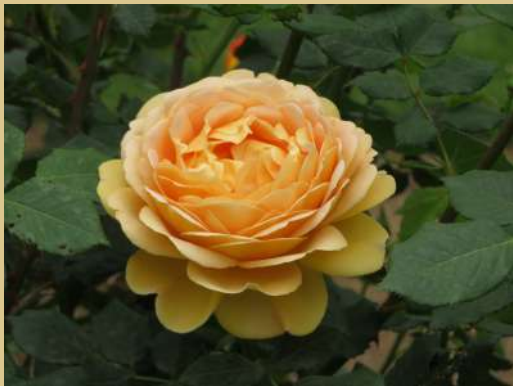
📍 東44 グラハム・トーマス Graham Thomas

It contains a fragrance component (Tea Rose Element) that is different from damask, based on the refined and legant tea leaves like fragrance.