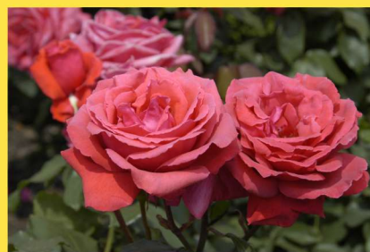
西26 フラグラント・クラウド