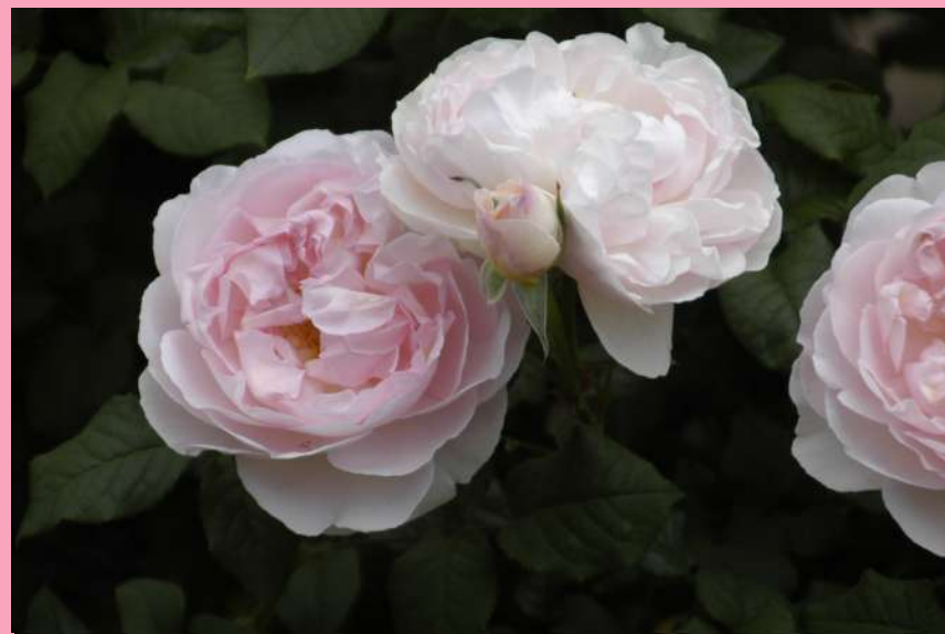
📍 東 4 1 ★シャリファ・アスマ Sharifa Asma