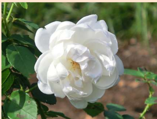
東50 グラミス・キャッスル Gramis Castle