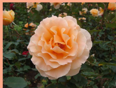
西23 ジャスト・ジョーイ