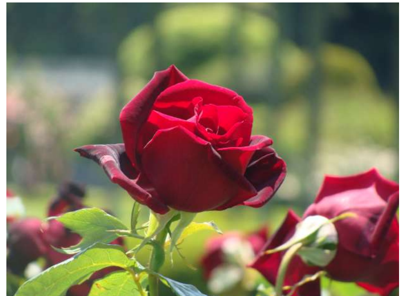
📍 東5 ★ パパメイアン Papa Meilland