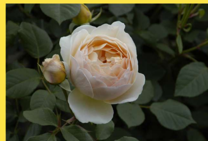
東46 ジュード・ジ・オブスキュア