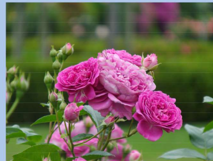
東8 ブルーボーイ Blue Boy

A scent that is a mixture of damask classic and tea scents, which is unique to "blue rose" varieties with a blue flower color.