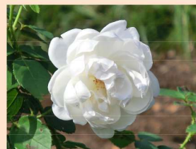
東51 グラムス・キャッスル Gramis Castle