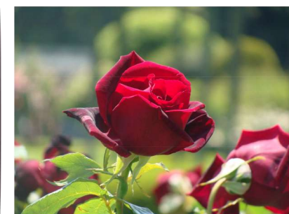
東 5 ★パパメイアン Papa Meiland