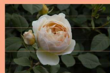
東47 ジュード・ジ・オブスキュア