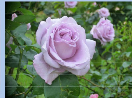
東9 ブルームーン Blue Moon