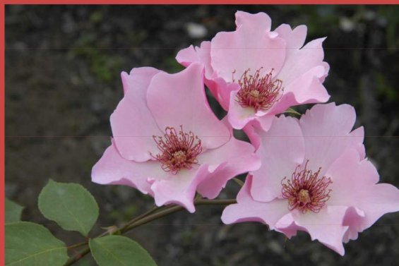
西12 デンティベス Dainty Bess

The basis of the fragrance is the Damask Classic, but also consists of clove and eugenol, the characteristic of carnations, leaving the entire fragrance with a hint of spiciness.