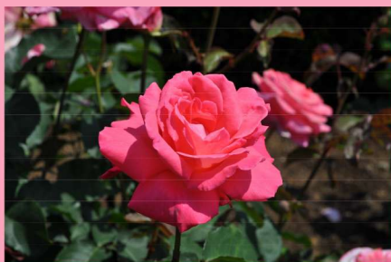
西 2 1 ホウジュン Hohjun

This rose has a classic rose fragrance which is commonly used for various purposes. It is a luxurious scent and includes Ingredients of fragrances of Tea.