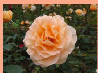
西23 ジャスト・ジョーイ