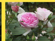
西 40 ユメカ