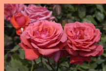
西26 フルグランド・クラウド