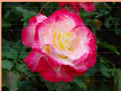
西25 ダブルデライト Double Delight

Damask modern scent and unique ingredients of tea are mixed in an exquisite balance.