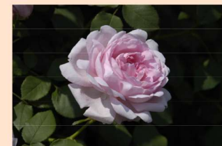
東43 ワイフ・オブ・バス Wife of Bath