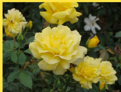
西 4 フリージア Freesia

A refreshing sweet scent reminiscent of fresh fruits such as peach and apple. Damask modern scent and unique ingredients of tea are mixed in an exquisite balance.