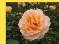
西 23 ジャスト・ジョーイ