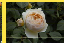
東 47 ジュード・ジ・オブスキュア