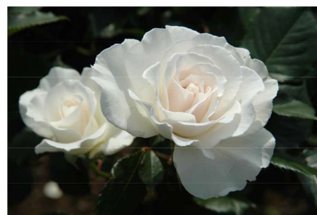
西 4 7 マーガレット・メリル Margaret Merrill

It transcends the fragrance of Damask Classic but due to its ingredient balance differing from the classic, it holds a more passionate, refined fragrance.