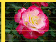
西 25 ダブルデライト