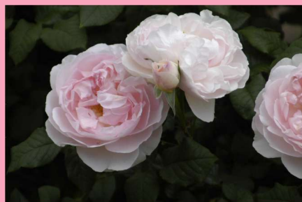
東 42 ★シャリファ・アスマ Sharifa Asma