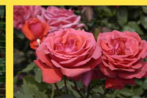
西 26 フルグランド・クラウド