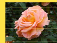
西 16 ラクエン