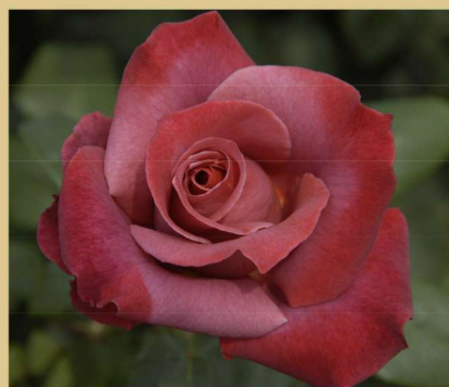
西 18 ブラック・ティー Black Tea