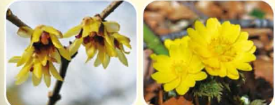
③ ロウバイ類 ④ フクジュソウ