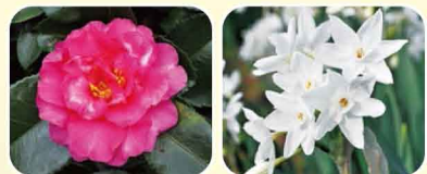
① カンツバキ ② スイセン'ペーパーホワイト'