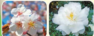
⑤ カンザクラ類 ⑥ サザンカ