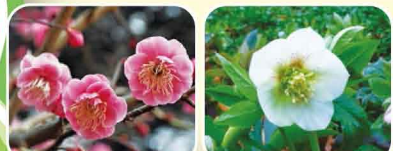
⑦ ウメ ⑧ クリスマスローズ