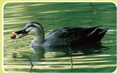
ドングリを食べる カルガモ