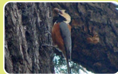
ドングリを 木のすきまに隠すヤマガラ