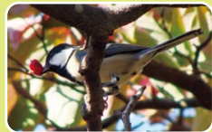
ハナミズキの実をくわえた シジュウカラ

「実りの秋」というように、秋は多くの植物の実ができる季節です。新宿御苑でもハナミズキやムラサキシキブ、マテバシイなどさまざまな果実が熟します。果実は都会で暮らす生きものたちにとって大切な食糧や住みかにもなり、生きものたちの命を支えています。秋の園内で生きものと果実のつながりを感じてみませんか。