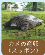
カメの産卵(スッポン)

新宿門近くの「母と子の森」は武蔵野の雑木林を思わせる自然観察フィールドで、さまざまな生きものがくらししています。自然観察を通して、生きものつながりを学んでみませんか。