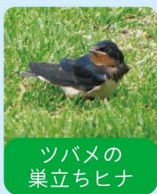
ツバメの巣立ちヒナ