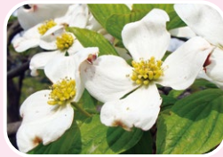
⑥ Flowering dogwood