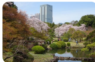
Japanese Traditional Garden