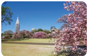
영국 풍경식 정원

신주쿠교엔에는 일찍 꽃을 피우는 벚나무부터 늦게 피는것까지 70종류 약 900그루에 달하는 벚나무가 있습니다.그중에서도 가장 인기 있는 벚꽃 명소를 소개합니다.