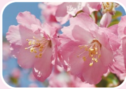
⑤ Hall crab apple