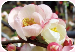
① Japanese quince