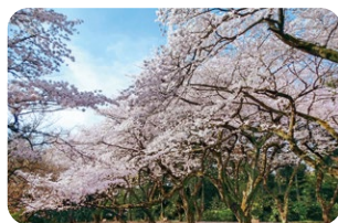
Cherry Tree Area