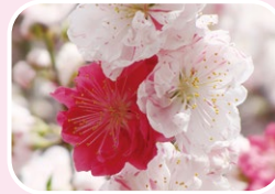
④ Peach 'Genpei'