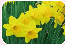
③ Wild daffodil