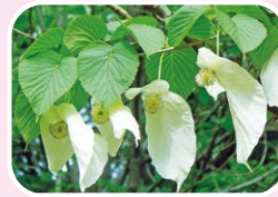
⑧ Dove tree