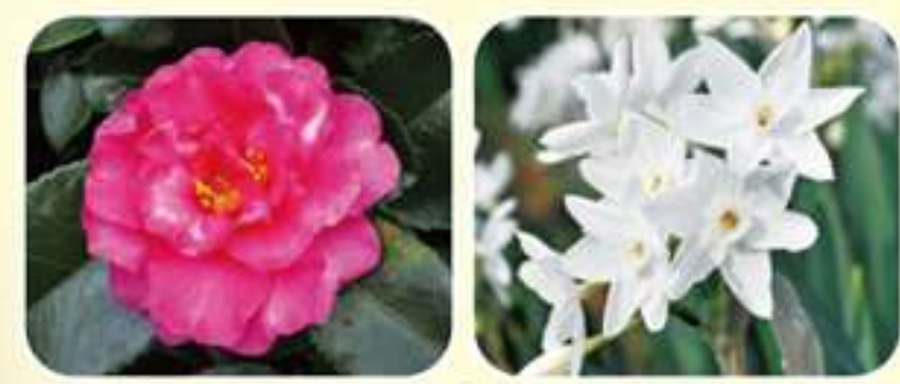
① カンツバキ ② スイセン'ペーパーホワイト'