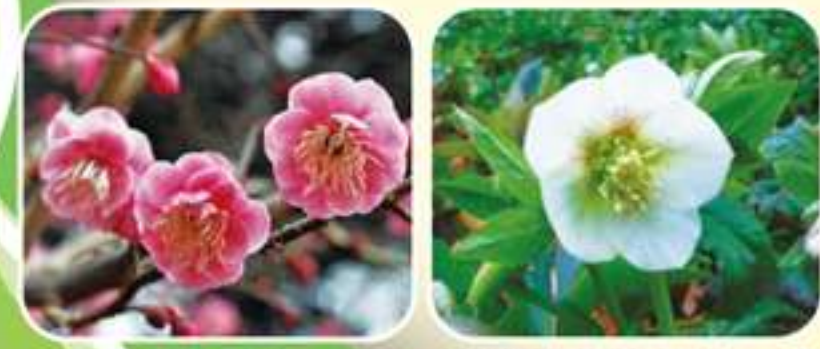
⑦ ウメ ⑧ クリスマスローズ