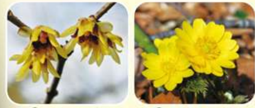
③ ロウバイ類 ④ フクジュソウ