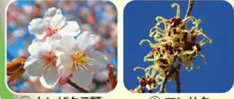
⑤ カンザクラ類 ⑥ マンサク