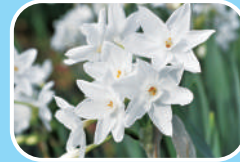
③スイセン'ペーパーホワイト'