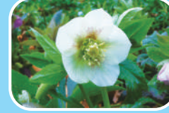
⑧クリスマスローズ