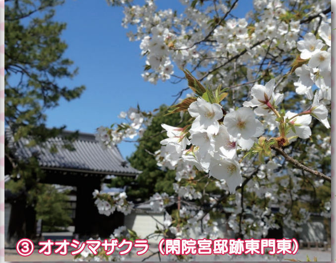
③ オオシマザクラ（閑院宮邸跡東門東）