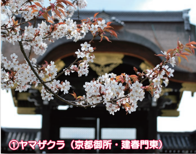
①ヤマザクラ（京都御所・建春門東）