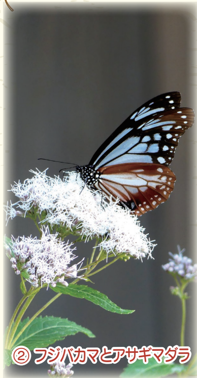
② フジバカマとアサギマダラ