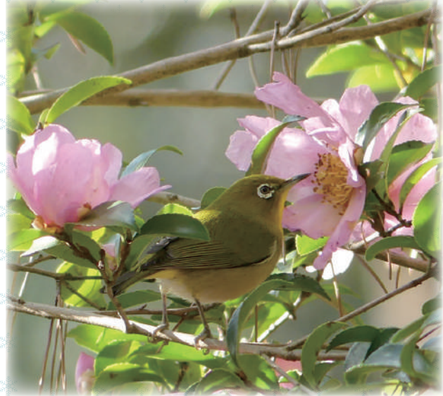
② サザンカ に メジロ