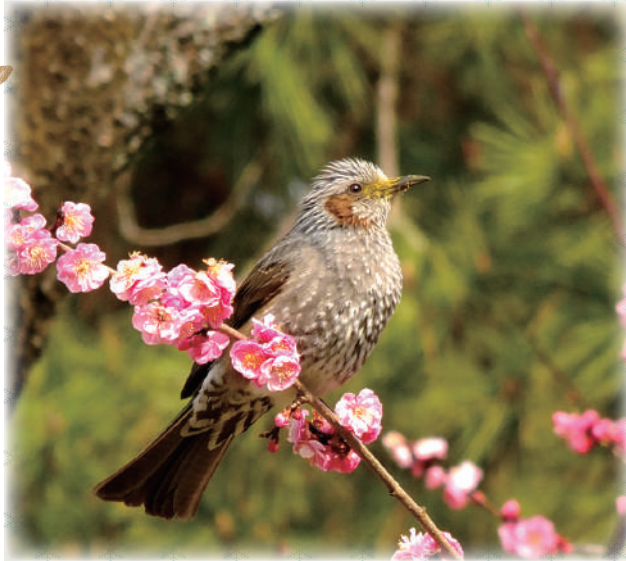
① ウメ に ヒヨドリ