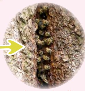
ニホンミツバチの巣