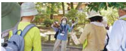
2022夏の自然教室の様子。緑の下で講師の話や参加者たち

青葉が繁り始める初夏。アオバズクが京都御苑にやってくる。京都府の準絶滅危惧種指定のフクロウの一種で、毎年営巣し子育てをする御苑のマスコットの存在だ。そんなアオバズクを夏の自然教室で見られるかもしれない。しかし、目や耳がいいアオバズクにとって人間の行動はストレスで、人間が近づいたり大きな声を出したりすると親鳥が警戒音を出すことがある。かつては警戒音を聞いた雛がパニック状態になり、巣穴から転落してしまうこともあったというが、今では保護啓発活動も進み、アオバズクが安心して子育てできる環境が整えられてきている。年4回開催の自然教室では、野鳥の他にも、植物、昆虫、きのこなど様々な分野の生き物と一度に触れることができ、今まで知らなかった自然同士の繋がりを知るきっかけになる。講師の方々の面白いお話が聞けるのも楽しめるポイントの一つなんだとか。参加を逃してしまった！という方は御苑のSNSを覗いて、ワクワクする豆知識や夏の風景を楽しんでみてはどうだろうか。