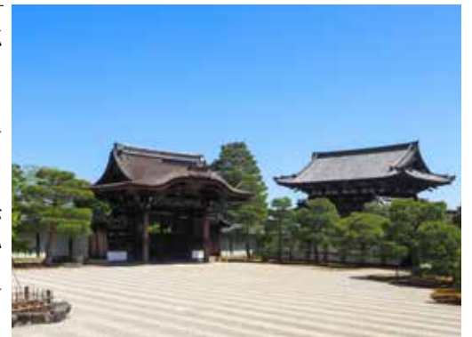
仁和寺御所庭園内南庭

さらに第八十代高倉天皇（一一六一～一二〇〇）や第八十八代後醍醐天皇（一二二〇～一二七二）の御宸翰（自筆）や、光格天皇の硯箱や文台など博物館や宝物館といった特別な場所で見ただけのような貴重な宝物も多数所蔵しております。また行幸の記録としては『御室御記』と呼ばれる日誌に、万治四年（一六六一）三月二十一日に後水尾法皇（第一〇八代・一五九六～一六八〇）が桜を御