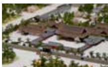
京都御苑ジオラマ模型 (1/500)

中立売休憩所に隣接する展示施設。京都御苑のジオ ラマ模型など御苑全体の歴史や自然を紹介していま す。(無料) 開館時間：9:00~16:30