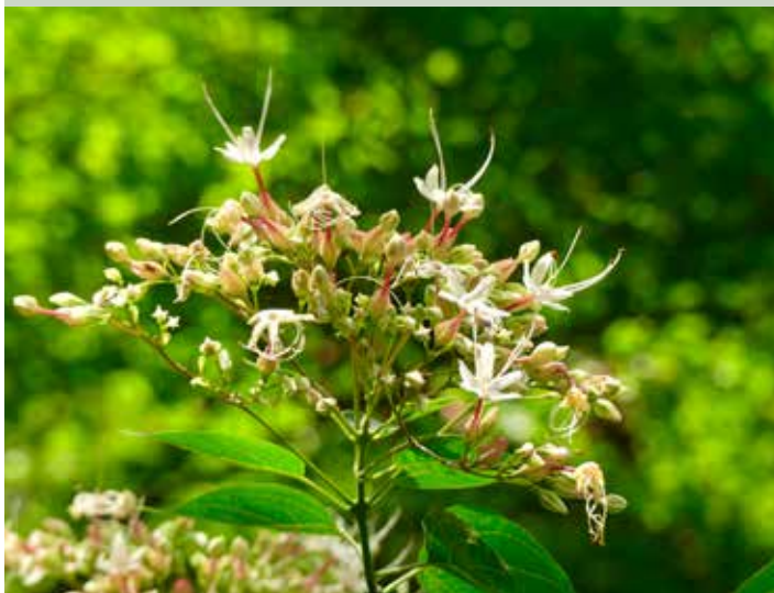
京都御苑の夏四景。左上から時計回りに御所建礼門とサルスベリ、夏鳥キビタキ、閑院宮邸跡床みどり、クサギの花