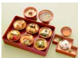
御所の華弁当 右近の橋(はもの切り 落しと付き)【要予約】

休憩やお食事・喫茶にご利用ください。京都御 苑オリジナルのお土産物も多数揃えています。 中立売休憩所(『京都御苑 檜垣茶寮』) 営業時間：9:00~17:00(夏期延長中) 京都御所前に位置し、御苑の木々に囲まれた「森の 休憩所」。中立売駐車場に隣接し、京都御所参観へ のアクセスは抜群。セットメニューから軽食、カフェまで 木の香る落ち着いた雰囲気の中でお食事ができ、売 店「檜垣」では、御所限定のオリジナル商品などを販 売。KYOTO-WiFi(無料)も利用可能。