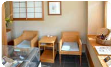
ゆば商品の並ぶ店内

いよつに、滋賀の大豆に富山の大豆を添えて、朝早くから豆乳を絞ります。長さ五斗の平