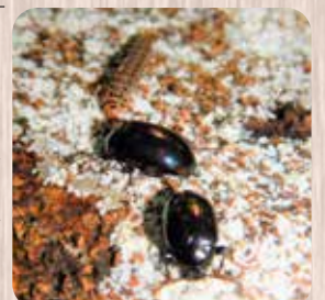
ナガニジゴミムシの幼虫は、鱗模様の体と大きな目玉模様を持っています。身に危険が迫ると上半身をグッと持ち上げて、ほら、ヘビそっくりです。こうすることで、ヘビが苦手な小鳥などから身を守っているのです。これもまた賢い戦い方です。 おや、親指ほどのヘビが枝の上に乗っています。これはヘビのあかちゃん、ではなく、ピロードスズメというガの幼虫です。ツタやヤブガラシ、テンナンショウなどの葉を食べるこの幼虫は、鱗模様の体と大きな目玉模様を持っています。身に危険が迫ると上半身をグッと持ち上げて、ほら、ヘビそっくりです。こうすることで、ヘビが苦手な小鳥などから身を守っているのです。これもまた賢い戦い方です。 ナガニジゴミムシの親は、翅が紫色の「虹色」に輝きます。

成虫になり、チーと単調な声で鳴き、メスを呼びます。時々見かける泥だらけの小さい抜け殻の正体は、このニイニイゼミです。 今度はあそこに切株がありますね。普段なら素通りしてしまいかもしれませんが、ちょっと待つて下さい。一緒に覗いてみましょう。ほら、ナガニジゴミシダマシたちが、せっせと食事をしていました。湿り気のある枯れ木にはさまざまキノコ(菌類)が生え、それを食べる虫たちが集まってきました。さながら、虫たちのレストランというわけです。虫たちが集まるのは、花の蜜や樹液だけではなく、このナガニジゴミシダマシの名前ですが、体の「長い(ナガ)」「虹色(ニジ)」の「ゴミムシ」に「似た虫(ダマシ)」という理由でつけられたと考えられます。