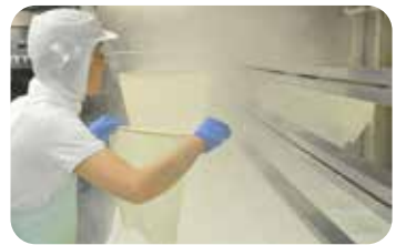
ゆばあげ作業の様子

休み、京極小学校でプールの後は隣の御所で虫取りして、また午後のプールへ。そんな御所の近くは昔から特に水の良いところ。店の地下六十センチから汲み上げる水はともやわらか。「ああ、この水なんだ。御所の側を離れなかつたのは」。その水を損なわな