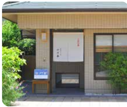
室町通に面する店舗