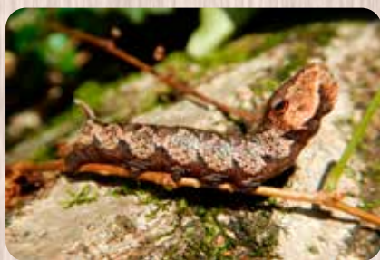
ピロードスズメの幼虫：体はちょっと短けれど、ピシッとへびになりきっています。

夏の京都御苑で楽しむ足元の昆虫観察、いかがでしたか。もちろん、見上げれば青い空を背景にチョウたちが舞ったり、水辺の周りではトンボたちが縄張り争いをしている姿も見られるでしょう。そんな昆虫界の花形はもちろんですが、そとと足元の世界にも注目してみてください。なかなか面白く、賑やかな世界が広がっていますよ。