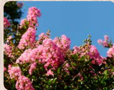
夏の青空とサルスベリ

夏、木々は青々と茂り、親離れが迫った鳥たちはあちらこちらを飛び回り、クマゼミやアラゼミは全身を震わせ声を張り上げます。サルスベリの桃色の花が苑内を彩ります。