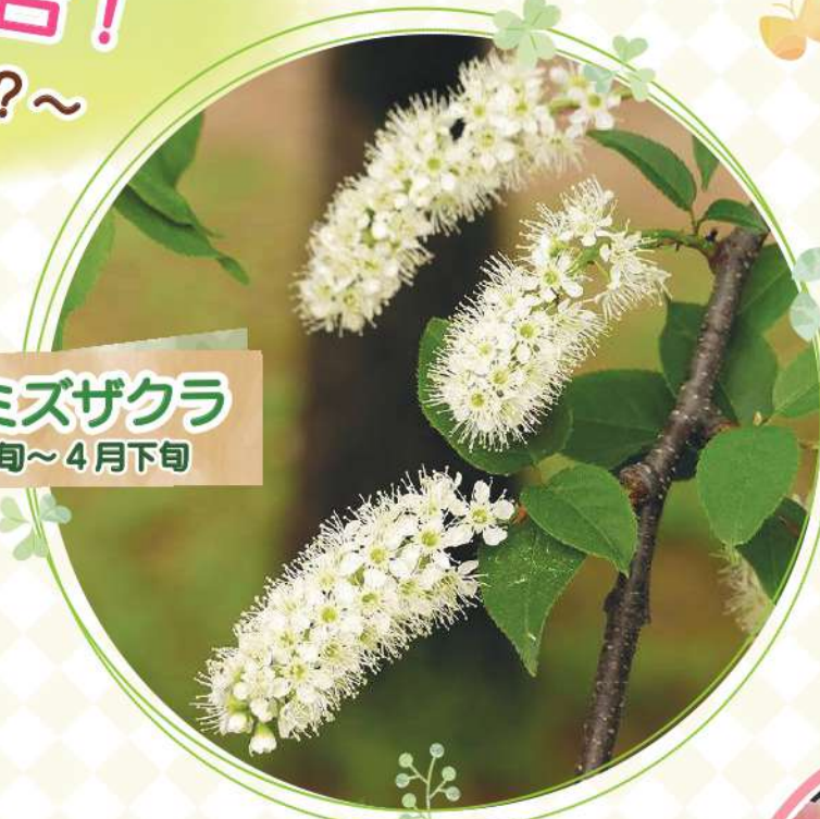
ウワミズザクラ 4月上旬～4月下旬