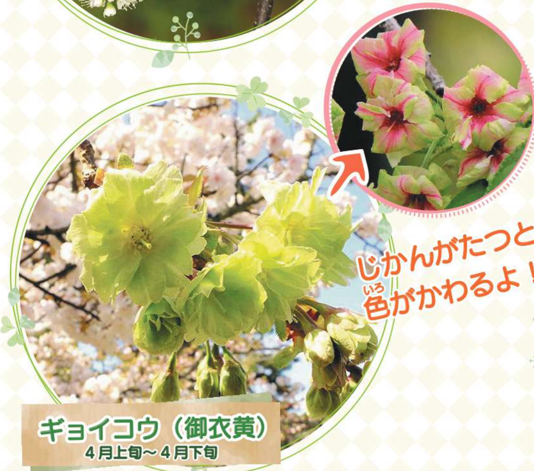
ギョイコウ（御衣黄） 4月上旬～4月下旬