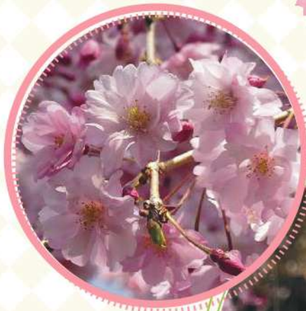
ヤエベニシダレ 3月下旬～4月中旬

きょうとぎょえん 京都御苑のさくら大集合！ だいしゅうごう ～いくつかのさくらを知ってるかな？～