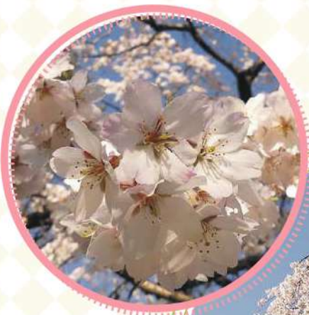
シダレザクラ 3月中旬～4月上旬