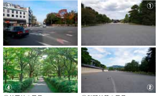
①御所外苑の風景 ②山並みへのビスタの風景 ③外周林の風景 ④小道の風景