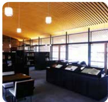
本棚のあるゆったりとした店内

虎屋菓寮 京都一条店では、江戸時代から残る土蔵や、季節の移ろいを感じられる中庭を眺めながら、四季折々の生菓子や羊羹、あんみつといった甘味をお召し上がりいただけます。また、店内には、日本文化に関わる書籍を約六百冊配架しており、お客様にはお好きな本を自由にご覧いただいております。