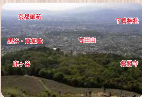
大文字山より望む京都市内の緑