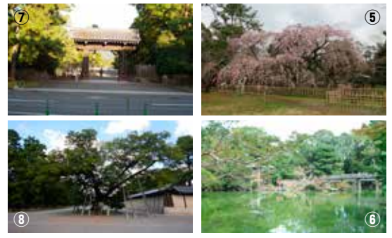
⑤花・紅葉の風景 ⑥庭園の風景 ⑦外周九門の風景 ⑧巨樹・名木の風景