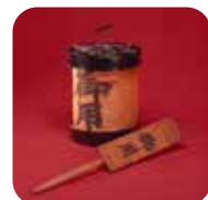
御所用のわかつて 御所用のいまず。 時代いらとその後、 江戸用提灯 明治二年 江用れる。 （一八六

九）の遷都に際し、明治天皇にお供して東京へも出店しましたが、京都の店はそのままだに、一条の地で営業を続け今に至ります。