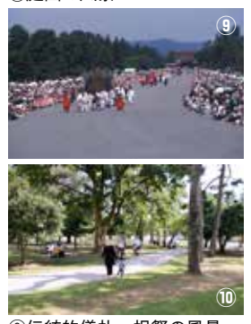
⑨伝統的儀礼・祝祭の風景 ⑩御苑らしい憩いの場・利用の風景

正利用の基準となるものであり、本計画委員会においても、改めてとなりますが、京都御苑の「価値」についてご議論をいただきました。