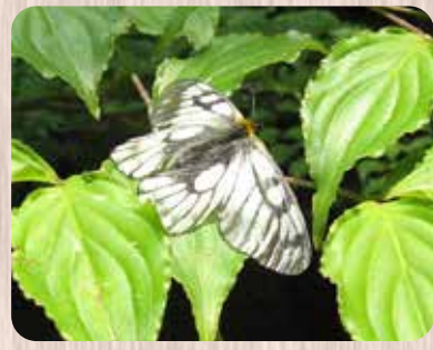
ウスバシロチョウ どこから来たの？

ります。この蝶は、少し透けた白色の翅を持つことからこの名が付けられました。アゲハチョウの多くの種が持つ後翅の突起(尾状突起)はなく、まるでモンシロチョウのようです。卵で越冬し、成虫は一年に春だけ姿を見せます。京都北山ではゴールデンウィークが過ぎた頃に開けた草地を軽やかに飛ぶ姿を見ることができます。幼虫の食草は、ムラサキケマン(ケシ科)などの若い葉を食べます。