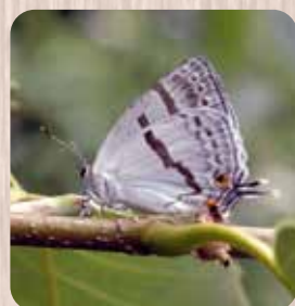
ミズイロオナガシジミ 初夏の雑木林の蝶

数年前に、ウスバシロチョウ(アゲハチョウ科)が複数個体、同じ場所で姿を現したことがあ