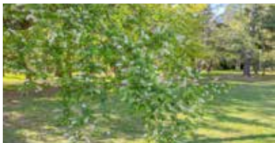
苑内のウワミズザクラ

奈良時代に編纂された『古事記』には、「天の香具山の鹿の骨を抜き取って、同じく天の香具山のハハカの木で占いを…」という文があるが、この「ハハカ」はウワミズザクラだとされている。記録に残る最古の花見は、平安時代に嵯峨天皇が神泉苑で開いたものといわれている。当時は、華やかな花を咲かせるヤマザクラが対象であったようだ。見た目では劣るウワミズザクラだが、花見よりも古い歴史を持っている。私達はどうしても、見た目が華やかなものに目が行きがちだ。しかし、時折足を止めて、これまで気にもしてこなかったものに目を向けてみると、思わぬ発見が待っている。京都御苑はそのような出会いに満ちている場である。