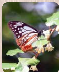
渡りをすることで知られているアサギマダラ

ます。こちらは、京都府立植物園でも一時的に発生することもあります。本来、河川敷のような開放的な草地で繁殖する蝶なので鴨川周辺の緑伝いにやって来たのかも知れません。しかし幼虫の食草のウマノスズクサが御苑にはないので定着することはできなかつたようです。 一方、渡りをする昆虫で知られるアサギマダラ（タテハチョウ科）やウスバキトンボ（トンボ科）は、例年見ることができず。アサギマダラは渡りの途中で立ち寄りです。ウスバキトンボは、御苑でもとても普通に見ることができると言えます。