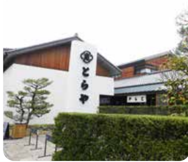
一条通に面する虎屋菓寮 京都一条店

虎屋は室町時代後期の京都で創業し、後陽成天皇御在位中（一五八六〜一六一一）より御所の御用を勤めてまいりました。現在虎屋菓寮京都一条店がある土地を、寛永五年（二六二八）に買い増した証文が残っており、この頃には御所にほど近いこの土地で商売をしていたことが