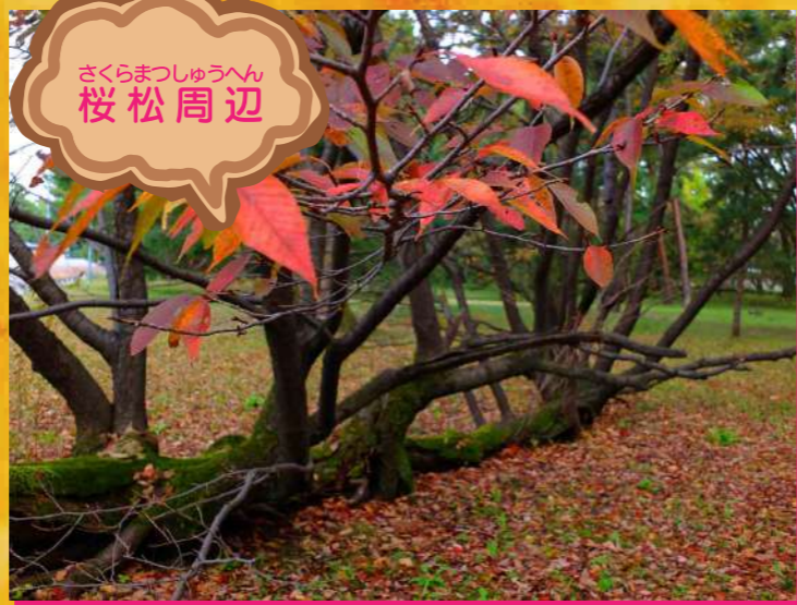
さくらまつしゅうへん 桜松周辺

横たわって花を咲かせる「桜松」は、周辺のイチヨウやモミジと一緒に美しく紅葉します。秋の虫たちの鳴く声がきこえるので探しにいってみよう!