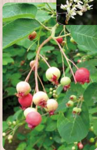
実をつけたジュンベリー