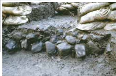
写真③ 旧池北岸の護岸 (南東から)