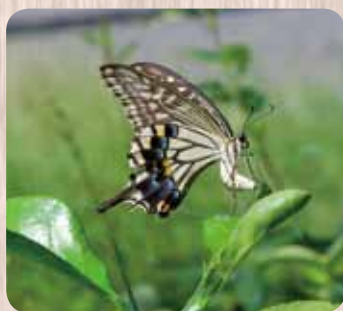
ナミアゲハの産卵

夏の樹林にはさまざまな昆虫が棲みつき、木々の葉を餌として利用している。同時にここは鳥が営巣する場でもあり、高タンパク質である昆虫類は雛の成長には欠かせない餌となっていて、時として凄惨な場面を目にすることも多い。 キノの木の下にカラタチが植えられている。よく見ると、白と茶色のまだら模様になった小さな幼虫と、黄緑色の大きな幼虫が懸命にカラタチの葉を食べている。いずれもアゲハの幼虫で、虎視眈々と狙っている鳥の眼を欺く迷彩服である。カラタチの木についている蛹は薄緑色であるが、他所に移動して蛹になったものは薄茶色になっている。カラタチの葉の匂いを使って巧妙な変身を遂げるのである。 落葉樹が多い京都御苑では秋の樹林地の地面は大量の落ち葉で覆われる。春になつても落ち葉の量は変わらず、さらに常緑樹の落ち葉が積もつて、春の終わりに、樹林地の地面に厚い落ち葉の層ができる。梅雨になつて、しとしとと降る雨に落ち葉は十分に水を含み、気温の上昇に伴つて勢いづいた菌類の営みによつて、みるみると分解され、夏の終わりに一年で最も少ない量となる。