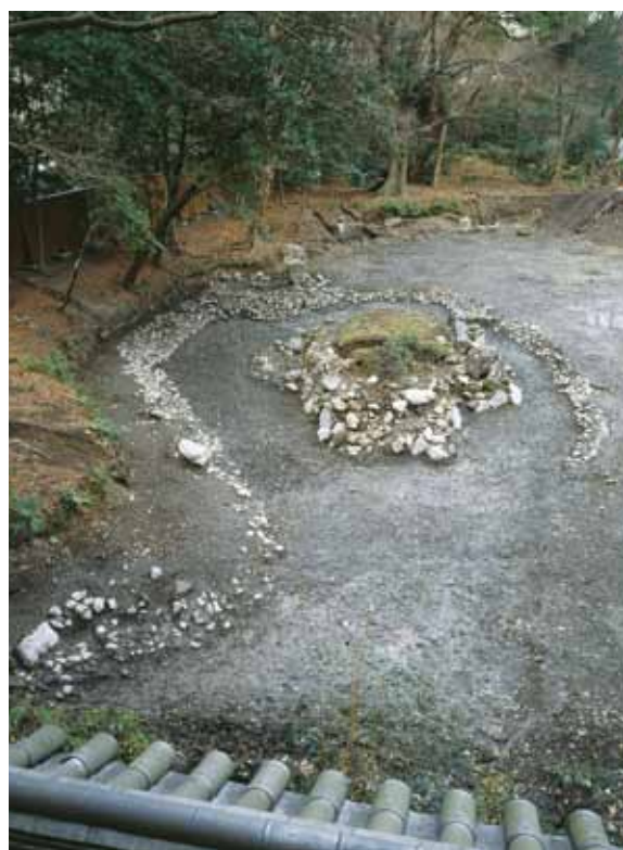
写真① 旧池全景(北東から)