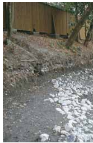
写真② 旧池南岸の洲浜 (北東から)