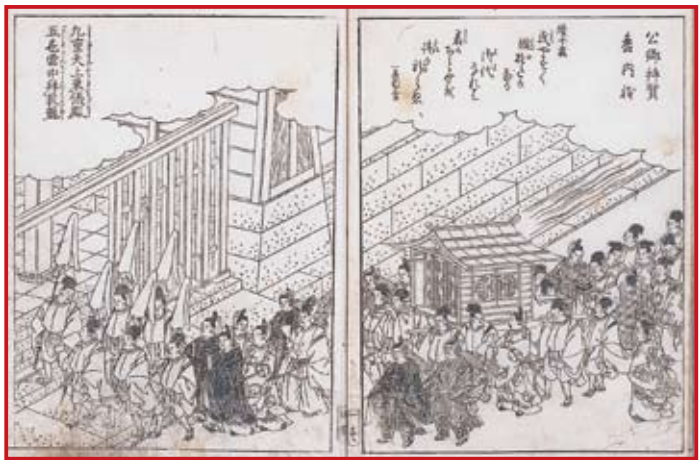
拾遺都名所図会 公卿門参内の図

所・撰家・宮家の高い家格の屋敷と、九門から禁裏に向かう道筋の両側にしか、土塀に瓦を葺いたしつかりした築地塀はなかったこと。したがって烏丸・丸太町・今出川など外郭の通りにも石塀（現在のものは一八七八〜八〇年に造られた）や築地塀はなく、公家町は京都の町続きのイメージであったことを説明する。そして江戸時代の京都の町人や旅人は自由に九門内に入るこ