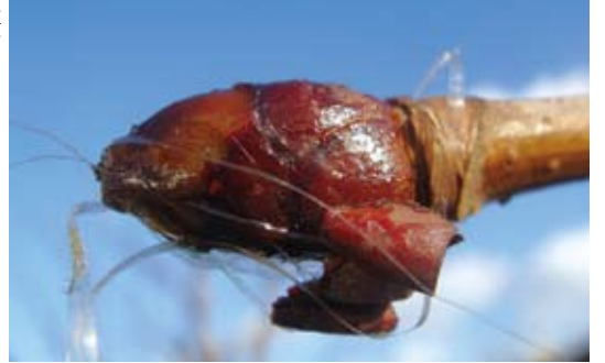
粘液に覆われたトチノキの冬芽