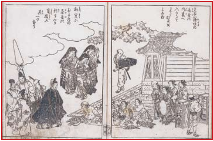
拾遺都名所図会 正月の禁裏御所南西角の賑わい

式や、節分・灯籠などの年中行事も見物できた。かつての開かれた朝廷や九門内の公家町のありようを想像してもらおう。 閑院宮邸跡をあとにして、九条邸跡では、明治前期の博覧会で料理屋や茶店が賑わった海女の潜水ショーが行われたことを、高倉橋の上で話す。御苑を南北に走る建礼門前の大通りは明治時代にできたもので、大札や葵祭で行列がゆく、もつとも重要なペイジエントの場であった。九条邸跡の厳島神社、花山院邸跡の宗像神社、そしてもう少し北に行つた西園寺邸跡の白雲神社からは、江戸時代の京都の町の人々にも開かれた信仰があったことがうかがえる。琵琶の屋敷内の神社である白雲神社には、妙音弁財天が祀られるが、寛政期から京都の町人の「巳の日講」があったことが残された灯籠からわかる。江戸時代には、公家屋敷も禁裏御所同様にかかれた空間だったのだ。さらに政治力のある宮であった朝彦親王邸跡の胎範碑をみながら北上し、一八六四年の禁門の変で来島又兵衛が自