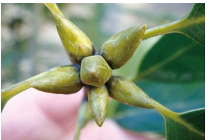
五角形のアラカシの冬芽