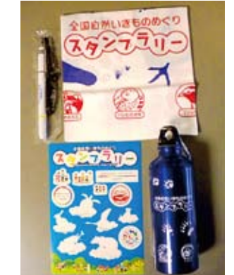
スタンプラリー景品