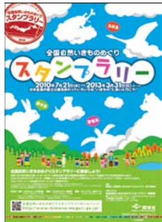
ポスター(休憩所に掲示してあります)

感嘆の声が聞かれます。目立たないため、気付かずに通り過ぎてしまうものだからこそ、観察してはじめて感動していただけるのでしょうか。あなたの身近にある木々も、いつか気づいていただける日をきつと待ちわびています。(京都自然観察学習会)