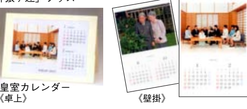
皇室カレンダー（卓上）

思っています。 ●新発売京都御苑限定 オリジナル商品 京都御所の土塀の北東の角のパワースポット「猿ヶ辻」、その「猿ヶ辻」にまつわるお話をゆるキャラタイプでイラスト化。 ●紙袋（マチ部分に英語・日本語入り） ・A4サイズ クリア ケース ・絵はがき 単品 以上三種類 発売しています。 そのほか、皇室カレンダー、壁掛、卓上共好評販売中。 （財団法人公園協会京都御苑業務第二課課長） の交歓の風景を、学生と共に思い起こすことにより、王権のありようは前近代と近現代とは大きく変容することを、考えている。 （京都大学人文科学 研究所准教授）