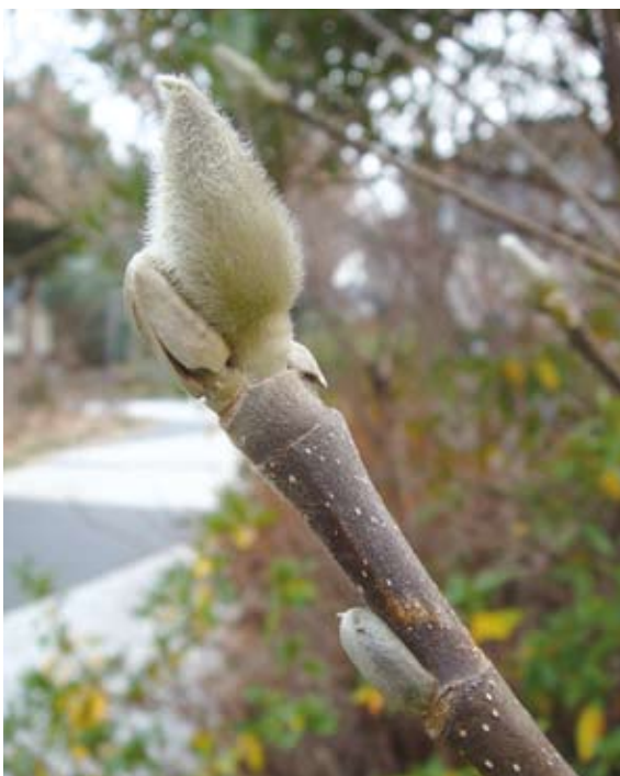
ハクモクレンの花芽(大) 葉芽(小)

池一般公開に参加するとシールがもらえます。集めた個数に応じ、景品をプレゼントしています。平成二十五年三月末(予定)まで開催していますので、全国の多様な自然に触れながらスタンプを集めてみてください。各施設工夫を凝らした展示やイベントを用意してお待ちしています。スタンプラリーの詳細につきましては、閑院宮邸跡に置いてあるチラシまたは全国自然いきものめぐりスタンプラリー公式HP ( http://www.kinono-meguri.go.jp/ )をご覧ください。