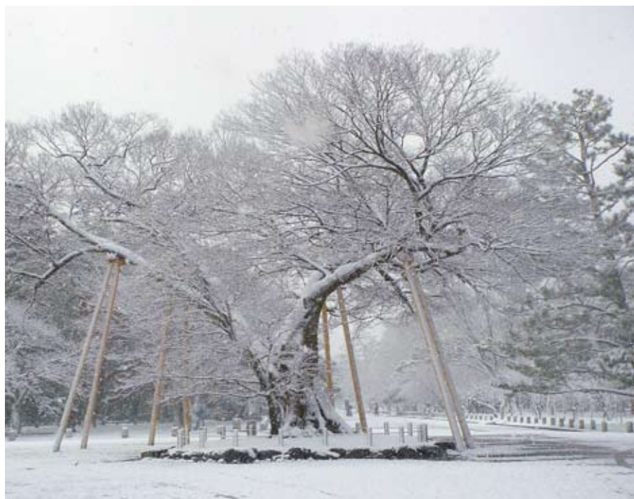
雪景色の清水谷家の棟