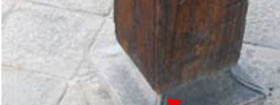
車寄せの柱に施された几帳面