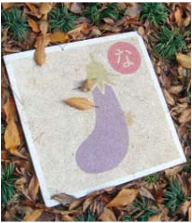
えさがしスタイル (デザイン：住谷早香)

課題の進め方として毎年、前半は京都御苑の現地調査、来苑者へのアンケート調査を実施しています。実際、大阪をはじめ、近県に住んでも京都御苑に自ら来たことのある学生は意外と少ないのです。そのようなことから、京都御苑がどんな環境で、そこに来る人たちは何を目的