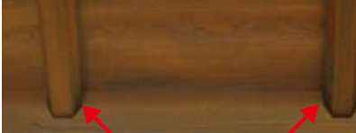
車寄せの猿類天井

に、どんな行動をしているのかを自らの五感で、しっかりと体現してもらおうが狙いです。すると、知らない人から、もっとうこうして欲しいという要望を受けたりとか、ここを何とかしてくれと言われたり、学生が報告してきます。多分、京都御苑に対して思い入れの多い方なのでしょう。学生からしたら、私たちは調査をしていただけなのに、そんなこと言われても戸惑いを覚えます。しかし、それも多様な人々に対して、どのようなことがデザインで可能なかを考えるにはとてもいい経験だと考えています。その後、前半の調査を経