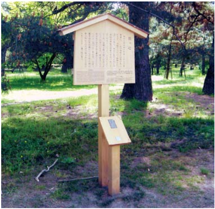
歴史ふれあいの道 (デザイン：重本晋平)

毎年、夏の暑さの熱りがさめた九月の半ばより、環境省京都御苑管理事務所のご協力をいただきながら「京都御苑に設置するストリートファニチュア」という課題が行われています。これは私の勤務校である京都精華大学プロダクトデザイン学科インテリアプロダクトデザインコース三年生を対象とした課題です。今年で七年目となり、社会で活躍している多くのOB・OG達がこの課題と向き合っています。