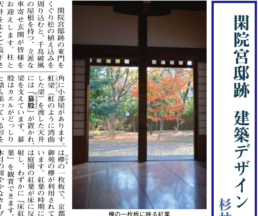
閑院宮邸跡 建築デザイン 杉林 江里香

閑院宮邸跡の東門をめぐり松の植え込みを周り込むと、千鳥破風当りにはなければならぬのは何なのか、自分たちが学んでいるデザインが多くの人にどうして何であって、何ができるのか。毎年、学生が苦慮するのは、京都御苑という場が、若いデザイナーの卵に、語りかけてくるが故だと思っています。