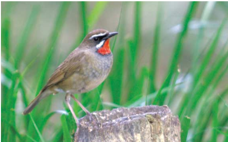
①赤い喉の下に黒い縁取りがあるノゴマ

体全体は、褐色を帯びたオリブ色の地味な鳥ですが、オスの喉は鮮やかなルビー色です。そのルビー色が際立つて目立つため「日の丸鳥」ともよばれています。メスにはこの喉の赤味はなく白いのですが、まれに赤味を帯びていることがあります。大きさは、スズメより少し大きくホオジロくらいです。白く長い眉斑と白いあご線もよく目立つ鳥です。ノゴマの喉の赤い部分との境界に黒い帯状の線がある(写真①)ところから、「オオノゴマ」というわさが広まり、遠方からも撮影に訪れる人が増えたのは昨年の五月のことです。以前に、このような個体を亜種「オオノゴマ」としていた時期もありました。現在で