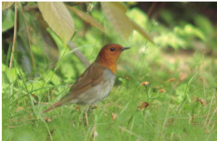
②さえぎりの美しさで名高いコマドリ

は、日本鳥学会の発行による日本鳥類目録(二〇〇〇年)のツグミ科ノゴマ属としては、シマゴマ・ノゴマ・オガワコマドリ・コルリの4種が掲載されているだけで、「オオノゴマ」の名称は掲載されていません。「各図鑑で調べてもオオノゴマという種名が掲載されていないが:。」という問い合わせがありました。図鑑もこの日本鳥類目録の分類に従って掲載されていて、「ノゴマ」として統一されています。ノゴマは、主に北海道で繁殖し、東南アジア周辺で越冬する夏鳥です。御苑には、春と秋の二回、渡りの途中に立ち寄っていきます。春は連休前後、秋は時祭前後に、大宮御所の西側の緑地の生垣付近に毎年現れます。この緑地に立ち寄っている