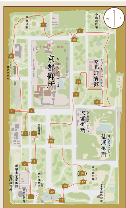
歴史ふれあいの道の順路

自然保護憲章 自然をとうとび、自然を愛し、自然に親しもう。自然に学び、自然の調和をそこなわぬようにしよう。美しい自然、大切な自然を水く子孫に伝えよう。