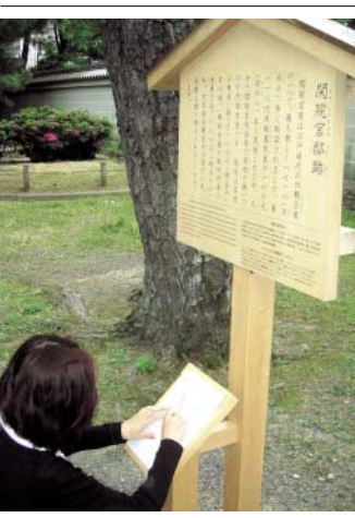
絵が浮かび出す駒札の前の板

（備考）京都御苑再整備基本計画書、歴史ふれあいの道案内いずれも、京都御苑ホームページから入手できます。アドレスは、www.enjy.go.jp/garden/kyotogyoenです。