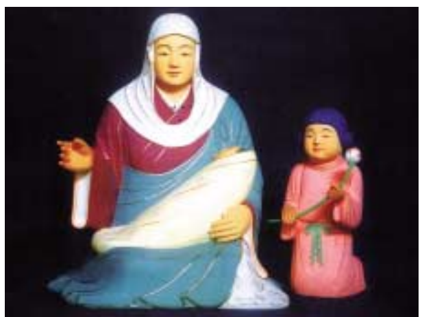
子育明神和氣広虫姫命像

育明神和氣広虫姫命を正式に御祭神に合わせ祀りました。和氣清麻呂公は、奈良朝末に怪僧弓削道鏡の野望を斥け皇統を守護され、また桓武天皇の御代には平安京への遷都を天皇に献策し、自らも造管大夫として