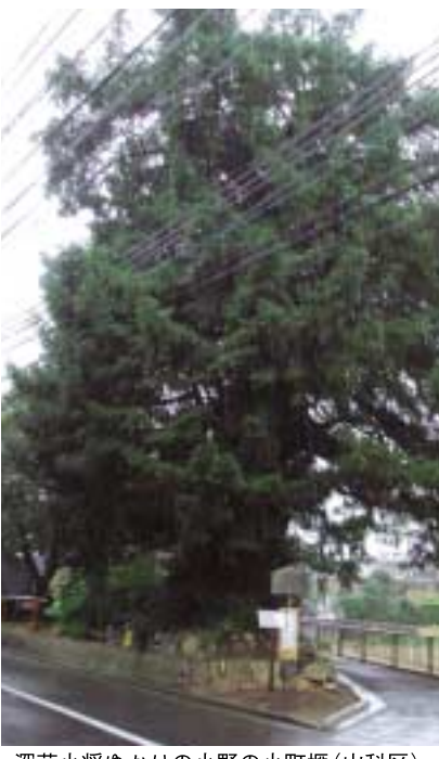
深草小將ゆかりの小野の小町権(山科区)

冬枯れの御苑、ムクやエノキの裸木に混じって、一際目を惹くのが針葉樹の仲間です。アカマツやクロマツが整然と並び、築地塀とともに御苑の風景として人々に親しまれています。なかでも、一段と高く威容を示している木に、モミとツガがあります。一見、よく似たこの木々は、古くから私たちに馴染みの深い木となっています。モミとツガはともにマツ科の針葉樹で、葉樹林帯から夏緑広葉樹林帯にかけての尾根筋や斜面上部などに