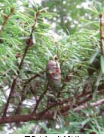
下垂するツガの球果

自然保護憲章 自然をとうとび、自然を愛し、自然に親しもう。 自然に学び、自然の調和をそこなわぬようにしよう。 美しい自然、大切な自然を永く子孫に伝えよう。