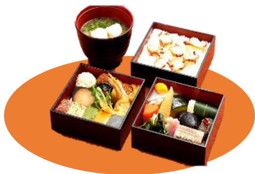
江戸エコ行楽重 (参の重)

特別史跡江戸城跡に指定されている皇居外苑の一角に位置する休憩所「楠公レストハウス」でしか召し上がり頂けない「江戸エコ行楽重」は、江戸時代の料理法と現代の食材が織りなす江戸の味を再現した商品です。