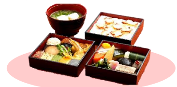
江戸エコ行楽重（参の重）

（ルート）有楽町線桜田門駅皇居方面改札口⇒国会前庭⇒国会議事堂（外観）⇒三年坂⇒文科省⇒虎ノ門⇒経済産業省⇒鹿鳴館跡⇒日比谷公園⇒祝田橋⇒楠公レストハウス（お食事）