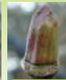
モミジバスカゲキ