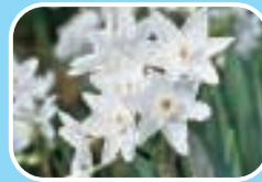
③スイセン'ペーパーホワイト'