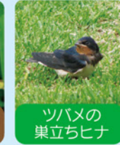
ツバメの巣立ちヒナ