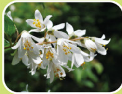
③ウツギ(別名ウノハナ)