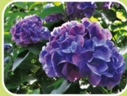
⑦アジサイ類(セイヨウアジサイ)