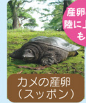
カメの産卵(スッポン)