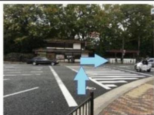
烏丸丸太町交差点