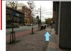
エレベーターから右に烏丸通を北へ