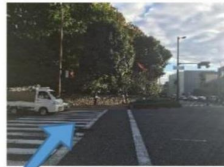
烏丸今出川を南へ