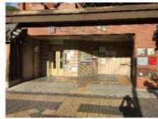
今出川駅3番出入口

御苑西側の烏丸通は、京都市地下鉄が通っています。京都御苑北側の最寄駅は今出川駅で、イトザクラのみどころ近衛邸跡・児童公園や京都御所へは、こちらが便利です。