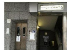
丸太町駅5番出入口

エレベーター：5番出入口（府立総合社会福祉会館：ハートピア） 京都御苑の南、烏丸通に面したところに出ます。 階段を利用の場合は1番出入口が最寄です。